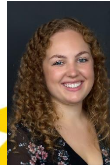
Sekretariat: Fabienne Krezdorn